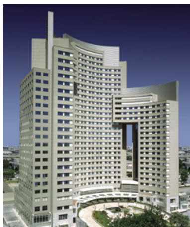
A volumetria proporciona diferentes perfis ao conjunto formado pelos edifícios: as fachadas se transformam de acordo com ângulo de observação. Fendas entre os blocos proporcionam transparência e suavizam o impacto visual das edificações geminadas

Uma torre de hotel, uma de flat e outra de escritórios compõem um volume arquitetônico único, de 62.550 m2, que se desenvolve ao redor de uma grande praça central. A idéia, que, segundo os arquitetos, foi inspirada na arquitetura barroca, em que praças são "abraçadas" por edifícios, venceu um concurso fechado promovido pela incorporadora Fal 2, do qual participaram outros dois grandes escritórios de São Paulo. Para Gianfranco Vannucchi e Jorge Königsberger, autores do projeto, o desafio consistiu na implantação do conjunto. "Tínhamos experiência com esse tipo de programa", explica Vannucchi, referindo-se ao Times Square Cosmopolitan Mix e ao Terra Brasilis, edifícios multiuso localizados em